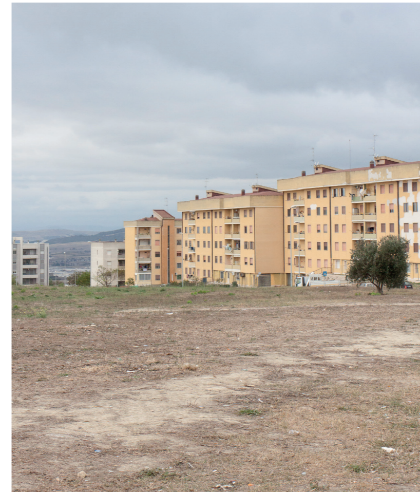
Fig. 2 Quartiere San Giacomo/San Giacomo Neighbourhood.