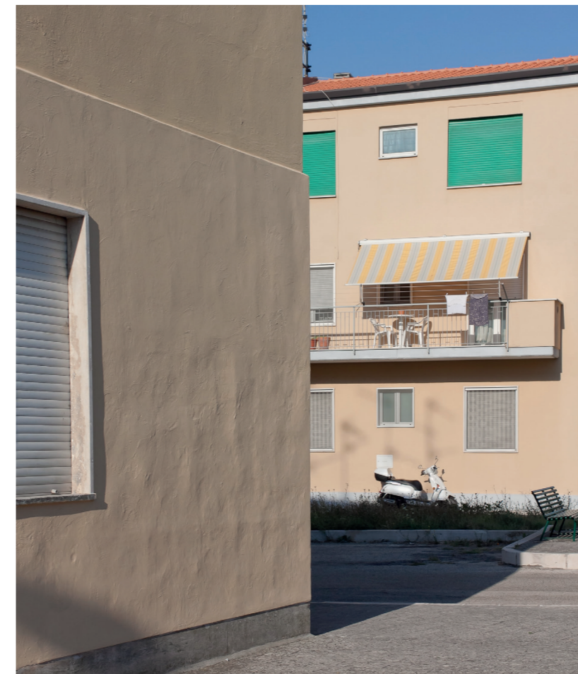
Fig. 1. Quartiere Serra Venerdi/Serra Venerdi Neighbourhood.

If the ground design wanted to redeem the residuality of unbuilt open space by resolving discontinuity and episodicity in systems that are not necessarily continuous, today, the term urban regeneration transfers the spatial dimension to the density of the concept of living, to the importance of space in producing interaction between people. The meaning of open space coincides with that of the common space, a topographical device whose meaning does not pre-exist, but is attributed to it by its use, whenever it is used 4 . The public character of these spaces is problematic, because it is produced by choice and, therefore, they are spaces that exist as a design tension of an interaction that will produce learning phenomena, in which diversity is learnt as a common value. Space is public if it produces the public 5 . The concept of urban regeneration is not new. As early as 1953, Frederick Gibberd referred to 'space body' when speaking of the autonomy of open space, and to the 'plastic body' when speaking about built space. 'Flesh and stones' was urban sociologist Richard Sennet's 6 way of defining the coexistence of two conditions of urban space and the mutual interactions that define the space of urban practices. Modern town planning has often referred to the term centrality or central space by deriving it from the hybridisation of two terms from different matrices: 'cen-