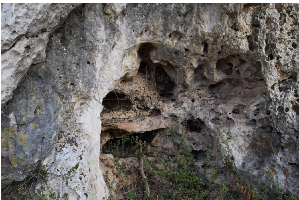
Figura 8 Il calcare di Ostuni, nella "Grotta Risieddi", altamente poroso