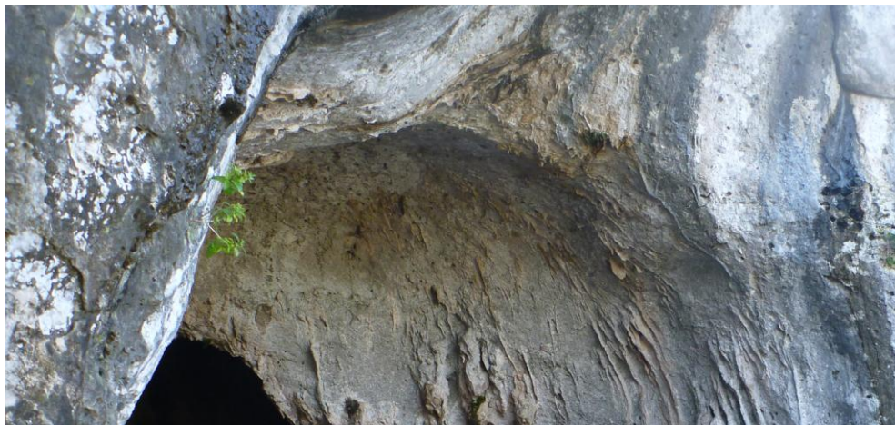
Figura 3 I karren ipogei all'interno della grotta