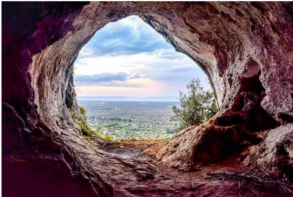
Figura 2 Panorama della valle degli ulivi dall'interno di "grotta Risieddi"

1990) ma, nel caso in esame rappresentano un elemento di morfologia ipogea, in grotta carsica, degno di studi di dettaglio, più specifici ed approfonditi.