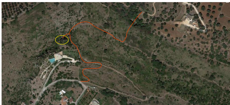
Figura 9 – Percorso proposto da attrezzare per raggiungere “Grotta Risieddi”

Un particolare impianto luminoso, a colori, potrà enfatizzare le peculiarità del geosito e del suo percorso anche con spettacolari giochi di luci. Profumi della vegetazione autoctona ed eventuali musiche di sottofondo potranno ulteriormente valorizzare la proposta.