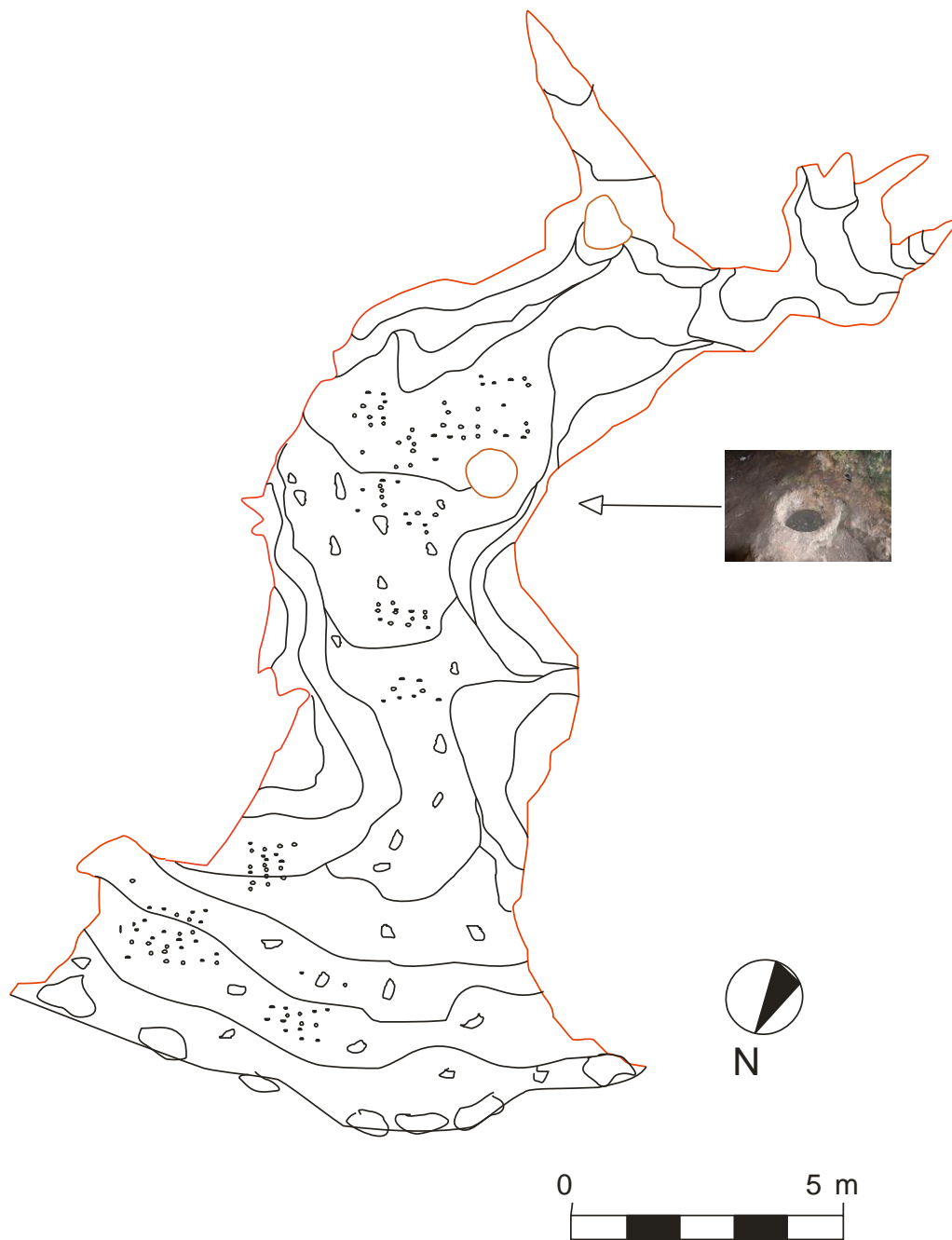
Figura 5 Rilievo planimetrico della grotta