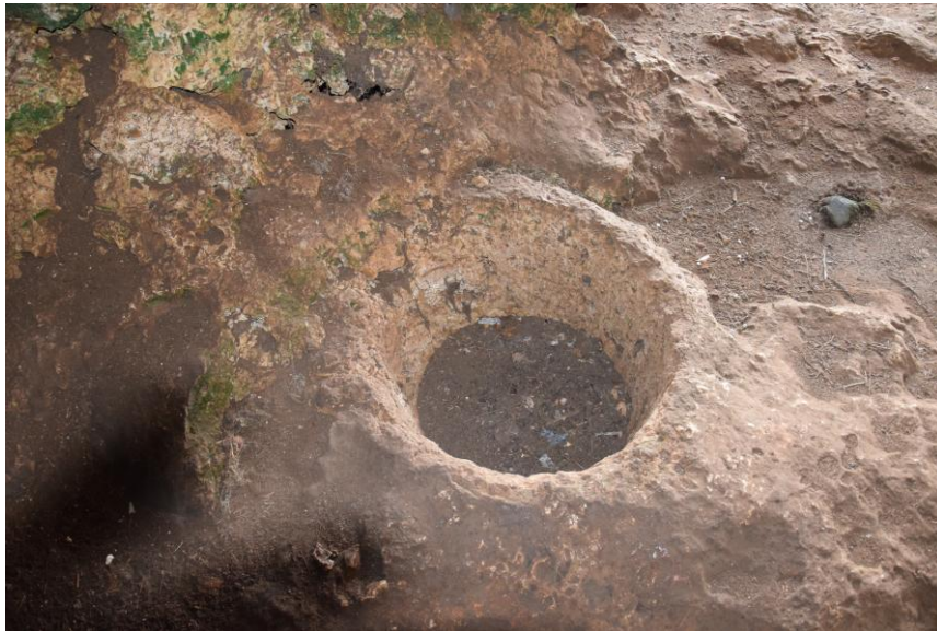
Figura 6 Abbeveratoio in calcare impiantato sul piano di calpestio