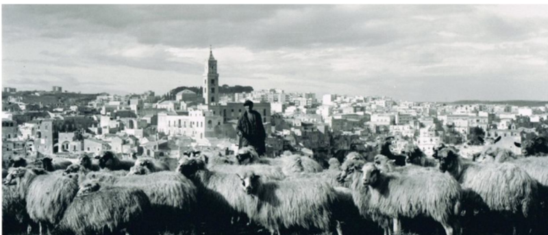
Matera Borgo La Martella