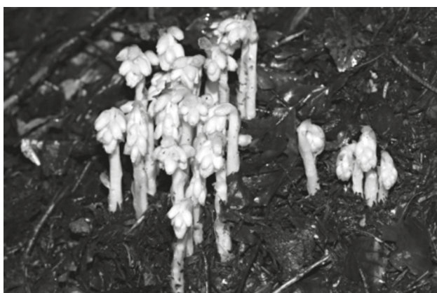
Fig. 2 - Individui di Monotropa hypophegea Wallr. presso Abetone (Pistoia), in una faggeta.