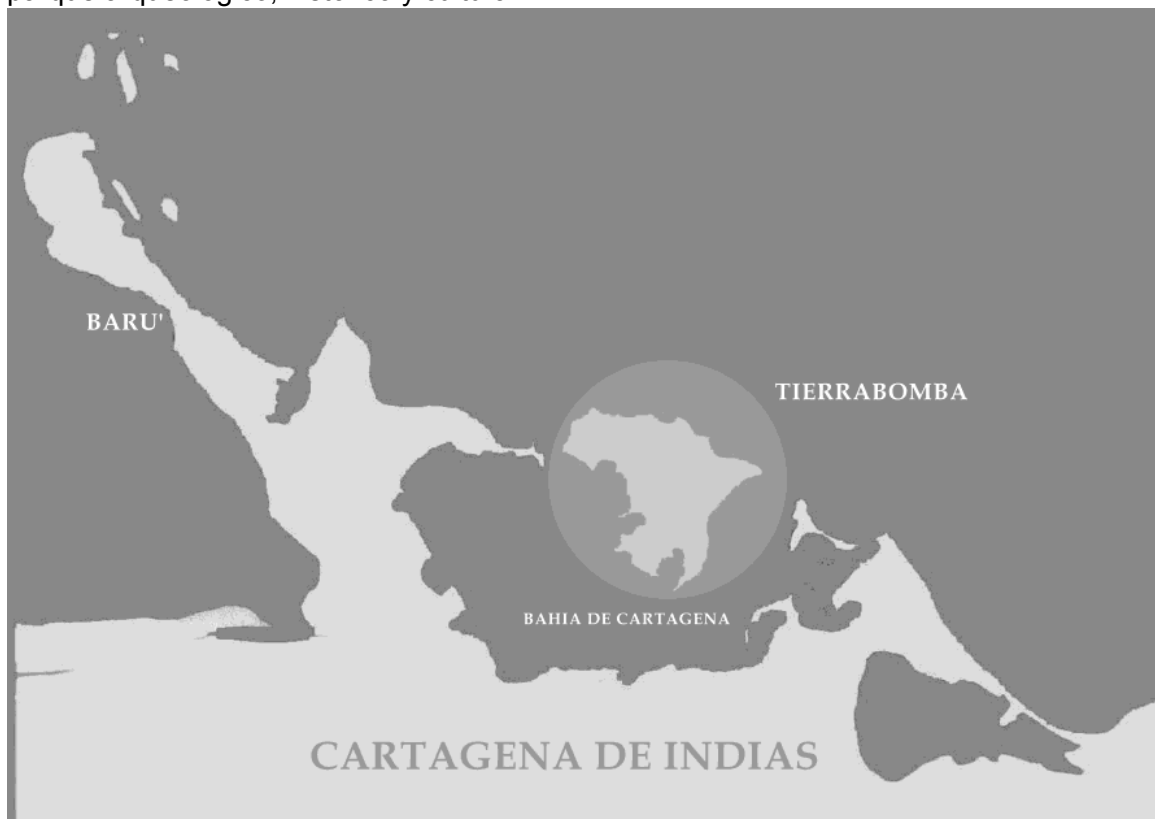
Figura 1. Localización de la isla de Tierrabomba.

El presente trabajo propone la adopción de una nueva estrategia sinérgica de desarrollo sostenible que supera el tradicional enfoque al salvaguardia del patrimonio. La visión estática y restrictiva de patrimonio entendido como un lugar, una manufactura o un testigo de preservar es ampliada y amplificada a fuerza arrastrante en un escenario de desarrollo sostenible que preve la tutela del entorno y el desarrollo económico, social y cultural de la colectividad. Este enfoque innovativo es aplicado al salvaguardia de la isla de Tierrabomba en la bahía de Cartagena de Indias en Colombia a través de la propuesta de institución de un parque arqueológico, histórico y cultural.