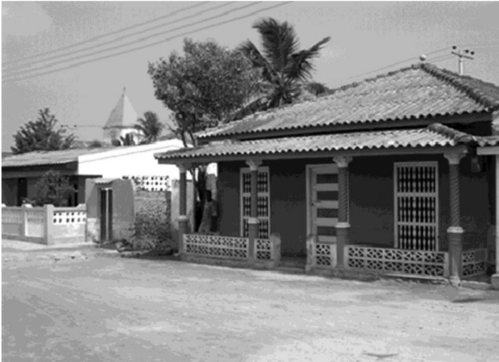
Figura 3. Tipologías típicas de las vivienda.

En la tercera fase se realizará la recuperación de todas las viviendas que tenga tipologías típicas de las casas vernáculas de influencia caribeña con gran belleza y policromía (Fig.3) logrando mejorar las fachadas. Se escogería una cantidad limitada de casas para que una habitación sea adecuada, patrocinada y manejada por un hotel de selección para que sea utilizada como alojamiento para el turista que desea involucrarse en el estilo de vida y costumbre de los nativos de la isla de Tierrabomba. De esta manera el propietario de la casa que sea seleccionado para prestar este servicio, tendría la posibilidad de generar ingresos ofreciendo al turista una atención especializada que incluiría alimentación (platos típicos).