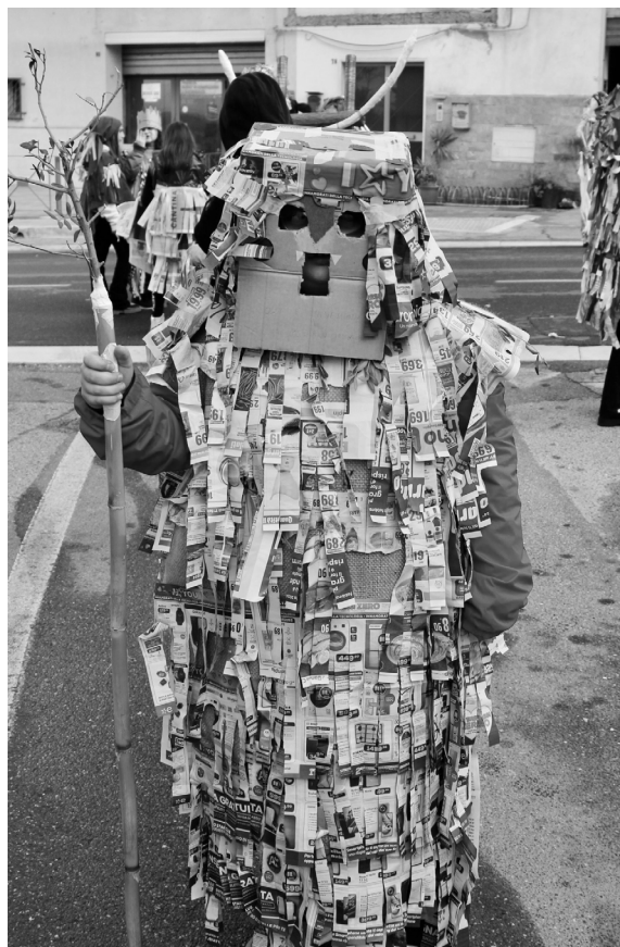
Fig. 1: Maschera del Carnevalone.

I metodi del design della comunicazione hanno permesso di rintracciare tramite interviste, memorie, storie, narrazioni legate a questo luogo, i racconti di una serie di eventi: dalle semplici proiezioni per grandi e piccoli, alle assemblee cittadine, alle manifestazioni femministe. Uno spazio di aggregazione, quindi, che l'abbandono ha reso silente. Allo stesso tempo sono vive nel paese le storie del Carnevalone. Per questo la ricerca si è tradotta in una proposta di rigenerazione che vede la nuova spazialità del Cinema attraverso ampliamenti volumetrici che fanno riferimento alle forme della