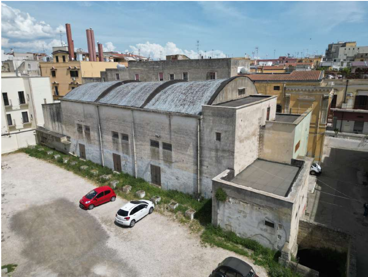
Fig. 2: Lo stabile del nuovo Cinema Santa Lucia a Montescaglioso.