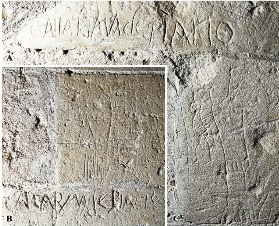
Fig. 4. Matera, Castello Tramontano: A) «Cantariana de pianto» inciso sul concio superiore della scalinata, seguito in basso (particolare C) dalla scena raffigurante un uomo impiccato, che pende dall'alto di una torre; B) «Cantarana de pianto» ripetuto sui concii inferiori e accompagnato in alto a destra da una prospettiva delle torri merlate del Castello Tramontano.