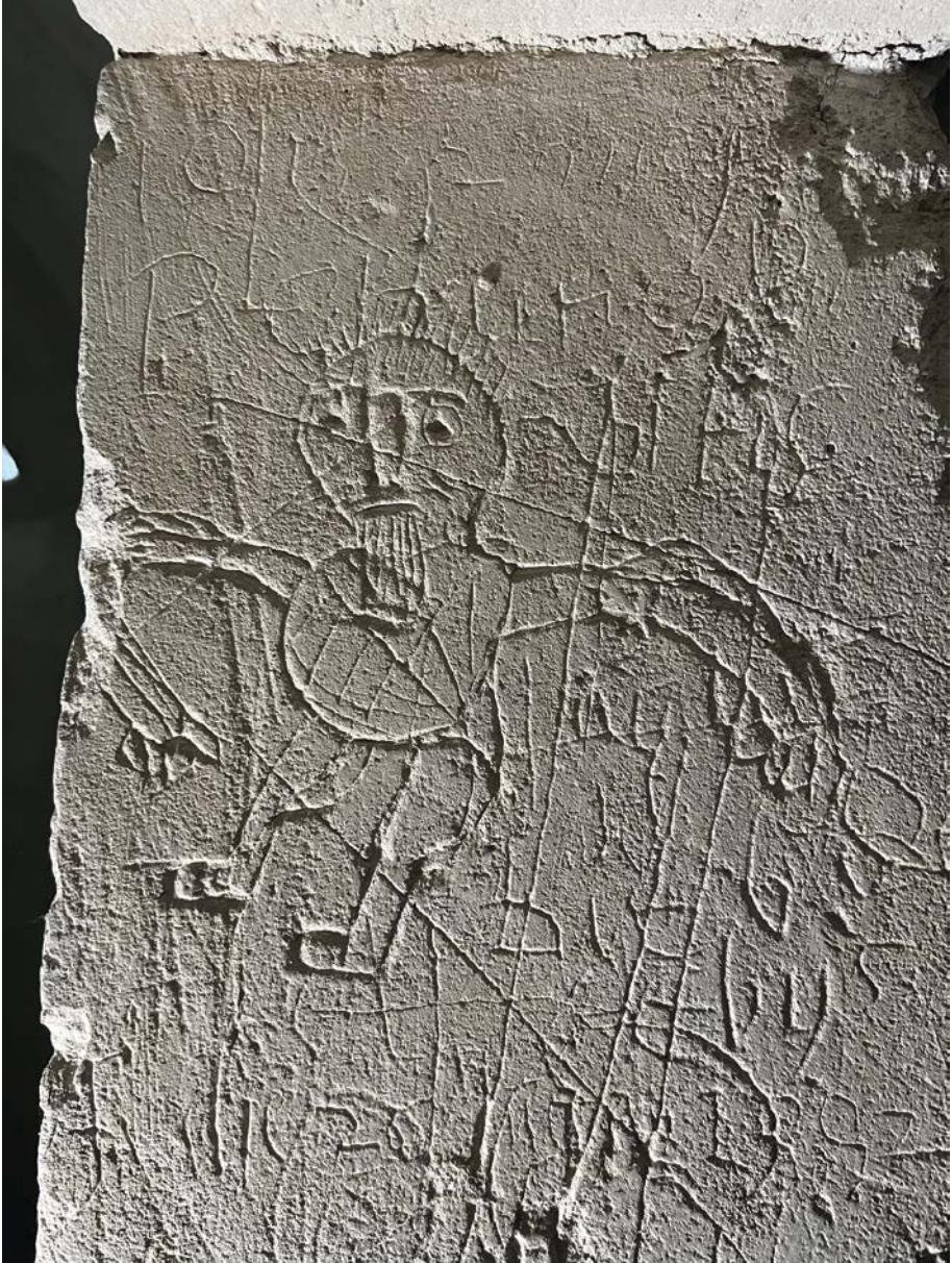
Fig. 3. Matera, Castello Tramontano, graffito di Petrutio de Vitis, ritrattosi incatenato a un muro.