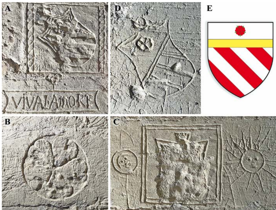
Fig. 5. Matera, Castello Tramontano, insegne araldiche degli Orsini presenti nel castello: A) scudo inscritto in un rettangolo con i fianchi abbelliti da torchon , a sinistra dell'ingresso a un ambiente radiale; B) la rosa a cinque petali cuoriformi scolpita a destra dell'ingresso all'ambiente radiale; C) scudo danneggiato, con una trangla centrale, inciso tra sole e luna nell'imbotte dell'ingresso allo stesso ambiente; D) insegna completa, ancora ben conservata su un concio di imposta della sala al piano terra del mastio; E) l'insegna degli Orsini descritta da Crollalanza.