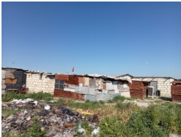
Borgo Mezzanone, aprile 2023

Pubblicato il 1 luglio 2026 da Comitato di Redazione