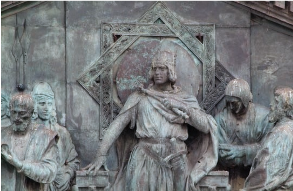
Francesco Jerace (1910): Federico II dà ordine di istituire l'Università. Frontone della sede centrale dell'Ateneo.

« A d scientiarum haustum et seminarium doctrinarum», ovvero «alla fonte delle scienze e al vivaio dei saperi»: è questa l'iscrizione che campeggia sul portone d'ingresso della sede principale dell'Università di Napoli, che dal 1992 è intitolata al suo fondatore, l'imperatore Federico II di Svevia. Non si tratta solo di un motto suggestivo o retoricamente evocativo: è identificativo, perché racchiude in sé la memoria di otto secoli di storia. Nel 1224, proprio con quelle parole, l'imperatore Federico iniziava una lettera circolare (o manifesto ) indirizzato all'impero e al mondo intero per annunciare l'istituzione dell'Università di Napoli: «in regnum nostrum desideramus multos prudentes et providos