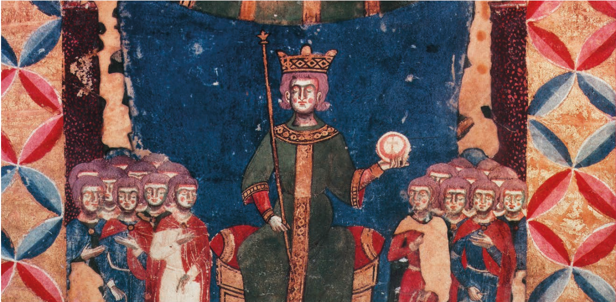
Salerno, Biblioteca Diocesana, Exultet, fol. 11, miniatura con re in trono, identificabile con Federico II.

F ederico, per grazia di Dio imperatore dei Romani sempre augusto e re di Sicilia, agli arcivescovi, vescovi e altri prelati delle chiese, ai marchesi, conti, baroni, giustizieri, camerari, giudici, balivi e a tutti i fedeli del Regno di Sicilia che leggono la presente lettera.