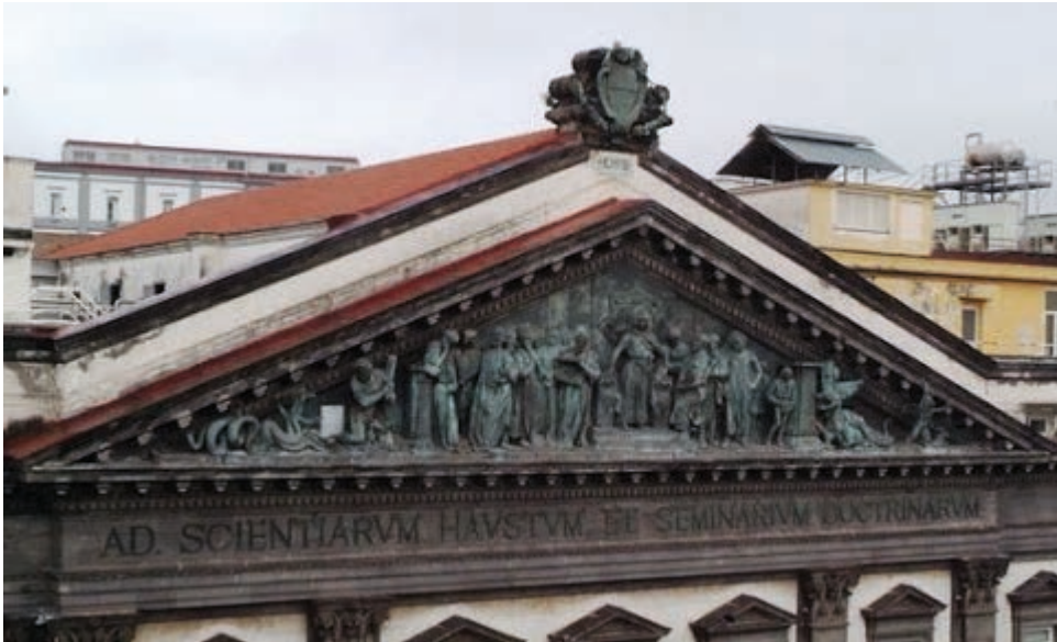
Figura 6. Francesco Jerace (1910): Iscrizione del frontone della sede centrale dell'Ateneo: «Ad scientiarum haustum et seminarium doctrinarum».

«Ad scientiarum haustum et seminarium doctrinarum»