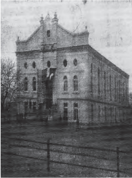
Pic. 2. International Izmir American College Gymnasium, March 1914