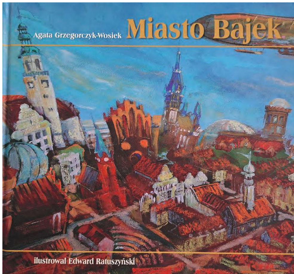
Pic. 1. Cover of the book entitled Miasto bajek [ The City of Fairy Tales ]