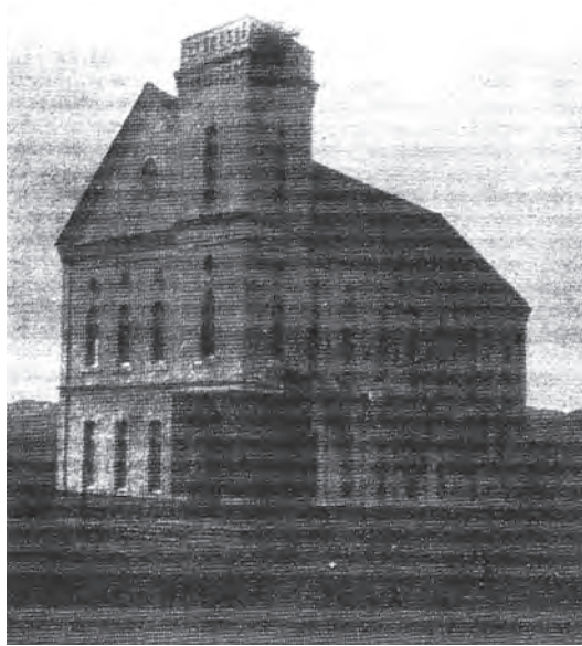
Pic. 3 International Izmir American College Meeting Hall, March 1914