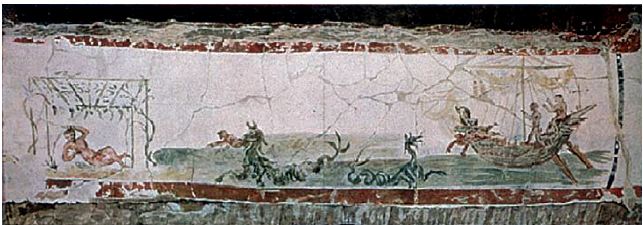
Fig. 8 - Catacombe di S. Callisto, Cappelle dei Sacramenti, Cubicolo 25, Roma. Affresco del III secolo raffigurante l'episodio biblico di Giona in tre scene (da Bonansea 2013, tav. I, fig. 2)

Nel programma iconografico di Santa Maria la Nova, tali figure mostruose sono state poste sul fronte est a fare da monito agli uomini, con la stessa funzione che avrebbe un Giudizio Universale dipinto sulla controfacciata di una chiesa. Avendo Santa Maria la Nova perso completamente il suo corredo di affreschi, non possiamo sapere se un'amplificazione del tema fosse presente anche all'interno. Di contro possiamo riscontrarlo in Cattedrale osservando il Giudizio Universale di Rinaldo di Taranto, nel quale il trono di Satana è retto da un