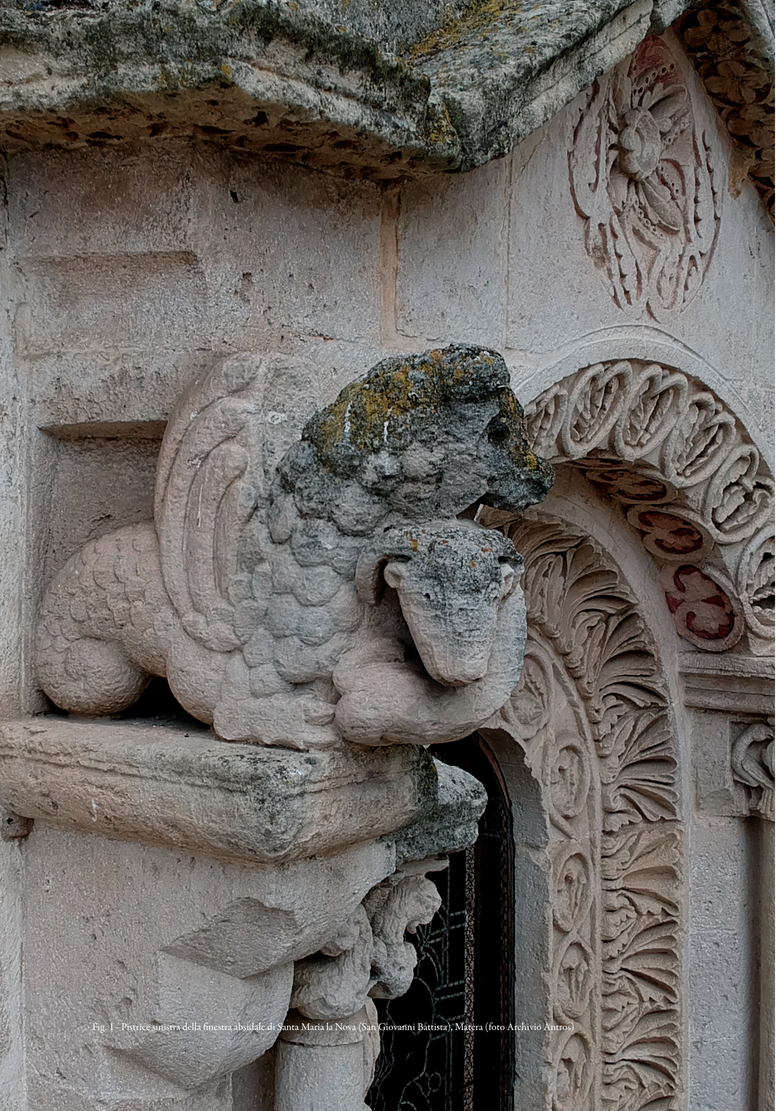
Fig. 1 - Pistrice sinistra della finestra absidale di Santa Maria la Nova (San Giovanni Battista), Matera