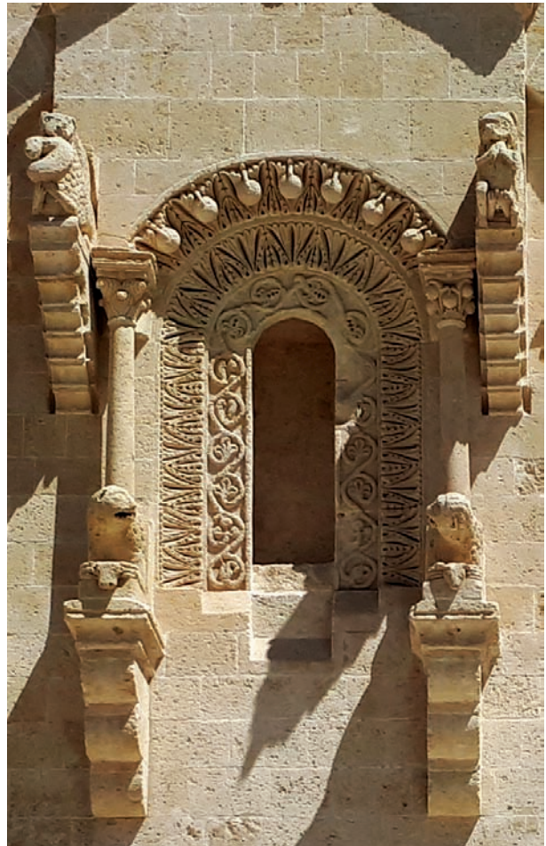
Fig. 4 - Finestra absidale della Cattedrale di Matera, spostata nel Settecento sul fronte meridionale

vaso proto-attico della metà del secolo VII a. C. e in un vaso proto-corinzio proveniente da Francavilla), l'animale appare con la testa di un cane o di un lupo. In altri esempi arcaici somiglia a un coccodrillo, con il muso lungo e appuntito, le orecchie lunghe, le branchie e pinne quali arti anteriori. In questo periodo risulta difficile riscontrare una versione univoca dell'animale (Riccioni 2016, p. 132), ma le rappresentazioni su vasi italoti del secolo IV a. C. (come la louthrophoros apula a figure rosse con Perseo e Andromeda 340-330 a. C., fig. 7), porteranno a delineare un "tipo classico" (come definito da Boardman 1987, p. 735), ovvero un animale «con la bocca aperta (con o senza appendici) e irta di denti, muso lungo e appuntito, occhi sporgenti, orecchie puntute ed erette, pinne anteriori pronunciate (a volte anche zampe di leone), collo lungo (spesso ritorto), ventre rigonfio, corpo anguiforme, terminante con una grossa pinna, in molti casi tricuspidata » (Riccioni 2016, p. 133).