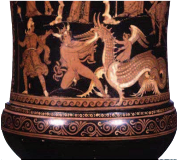
Fig. 6 - Museo archeologico di Monasterace (RC). Lacerto del mosaico pavimentale di un edificio termale del IV secolo a. C., con la pistrice detta "Drago di Kaulon"