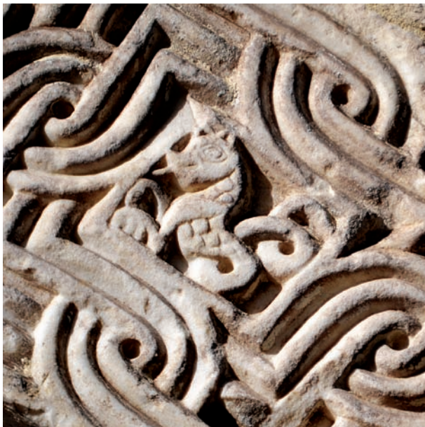
Fig. 13 - Santa Maria della Pietà, Montepeloso, oggi Irsina. Particolare della pistrice inglobata nel campo quadrato dell'archivolto scolpito con un intreccio nastriforme. I concetti qui reimpiegati provengono dalla scomparsa Abbazia di Santa Maria di Juso

Nel complesso la pistrice montepelosina somiglia già a un piccolo drago, segno di un mutamento iconografico che avrà grande fortuna nel corso del Rinascimento, quando le caratteristiche del mostro serpentiforme dalla testa sempre più allungata come quella di un coccodrillo e le squame sempre più coriacee, saranno assorbite completamente dalle sembianze dei draghi. L'influsso delle culture nordiche, difatti, soppianderà definitivamente la memoria classica dell'antica pistrice, destinandola all'oblio. Vedremo allora santi guerrieri combattere draghi sputafuoco e persino San Michele Arcangelo e la Vergine schiacciare uno, finché il drago soccomberà davanti