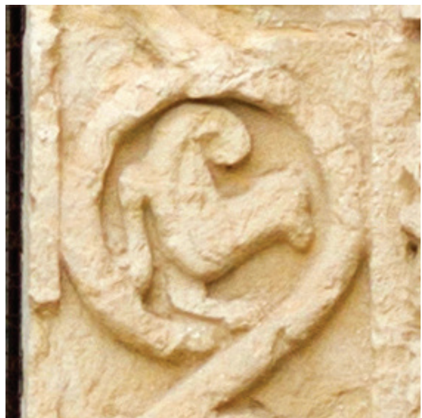
Fig. 5 - Finestra absidale di Santa Maria la Nova, Matera. Particolare della pistrice inglobata nel tralcio della ghiera

In periodo paleocristiano la pistrice fa la sua appari-