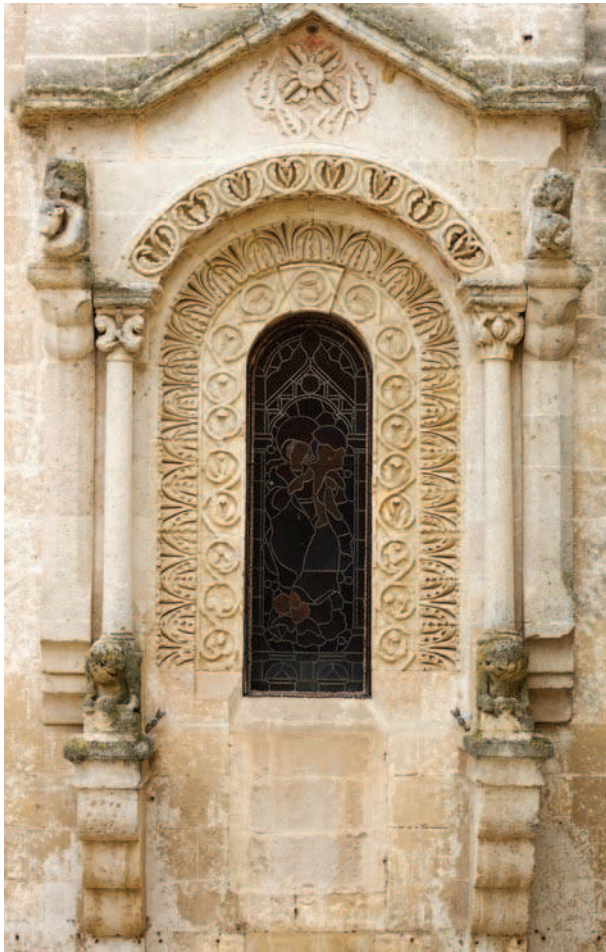
Fig. 3 - Finestra absidale di Santa Maria la Nova (San Giovanni Battista), Matera