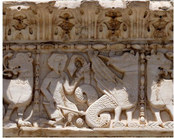
Fig. 11 - San Giovanni al Sepolcro, Brindisi. Particolare della pistrice scolpita sul piedritto sinistro del portale secondario, ascrivibile all'XI secolo; Fig. 12 - San Benedetto, Brindisi. Particolare della scena di caccia centrale scolpita sull'architrave del portale, XI secolo