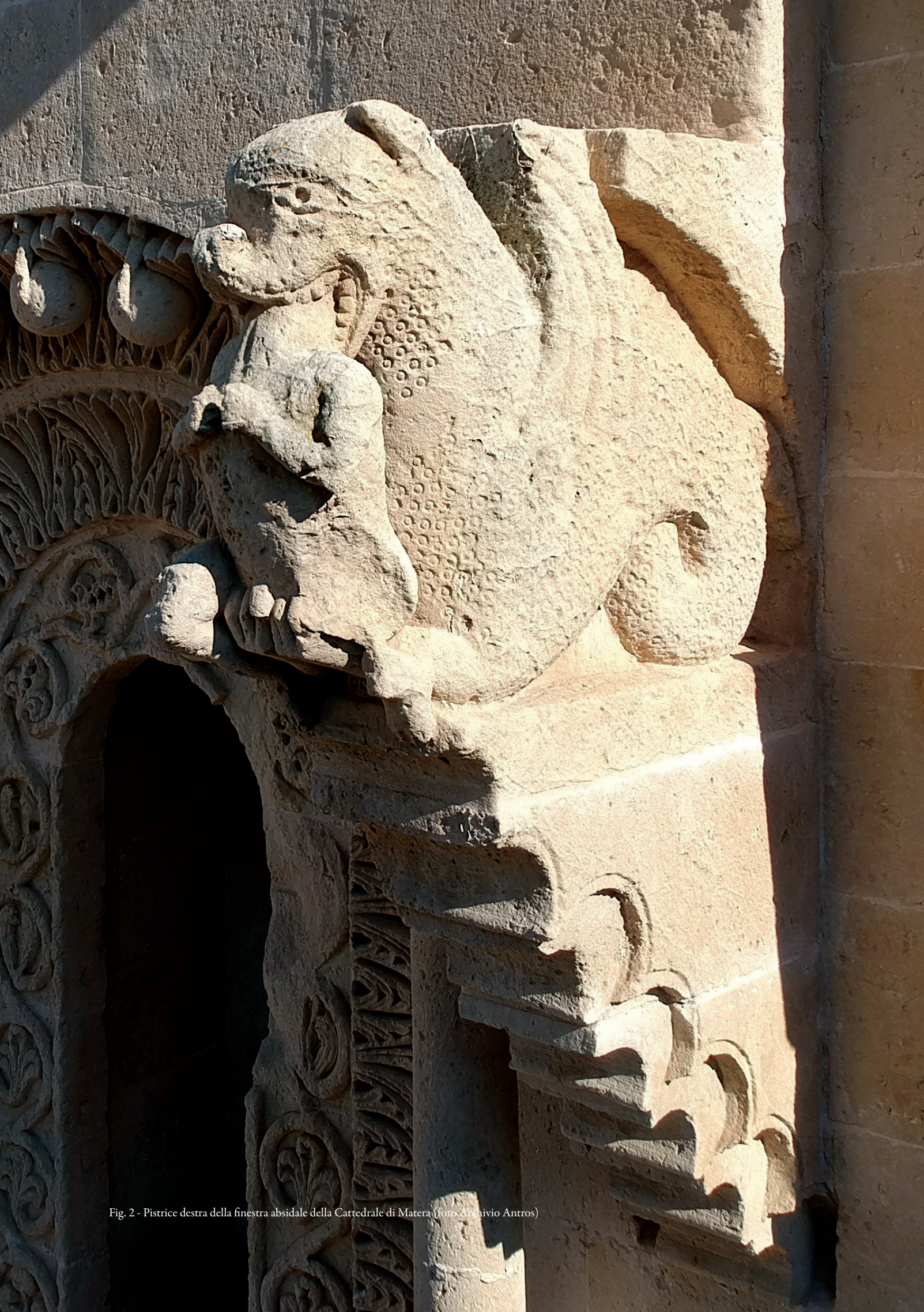
Fig. 2 - Pistrice destra della finestra absidale della Cattedrale di Matera