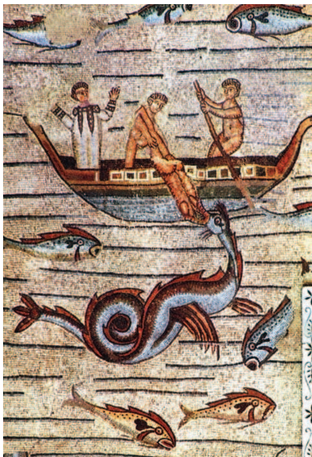
Fig. 9 - Particolare dell'episodio di Giona nel tappeto musivo della Basilica di Santa Maria Assunta, Aquileia (UD) del IV secolo

cane (o da un lupo) dal corpo serpentiforme infuocato, quale metafora di un servo del Male, mentre nella parte alta dell'affresco, una moltitudine di cetacei risponde al comando di rigurgitare gli uomini momentaneamente inghiottiti, ora chiamati a risvegliarsi.