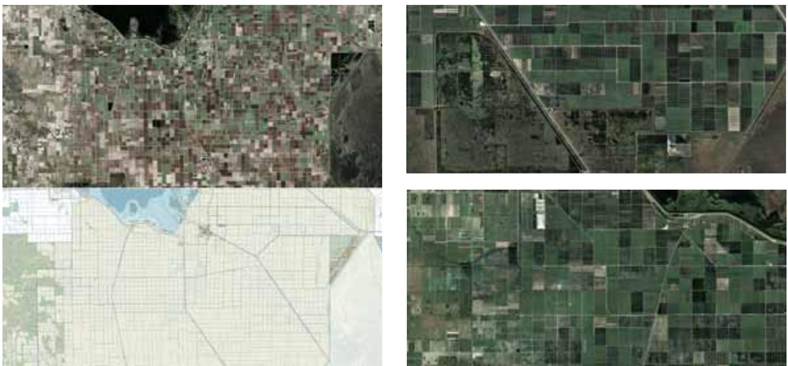
Fig. 10 | Module: EAA, its rural pattern and infrastructural system (credit: C. Brisotto and A. Raffa; sources: UF Geoplan Center-Florida Geographic Data Library e Google Earth, 2023).