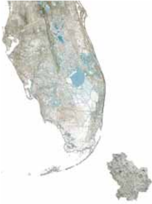
Fig. 1 | Modern Reclamation Landscapes: scalar comparison between Everglades and Metaponto Plain (credit: the Authors; sources: UF Geoplan Center-Florida Geographic Data Library and RSDI Basilicata, 2023).

l'agricoltura e per attività ricreative, ma anche con aree boscate e un ambito ad allagamento controllato dove vengono inseriti spazi per l'allevamento ittico e la rinaturalizzazione.