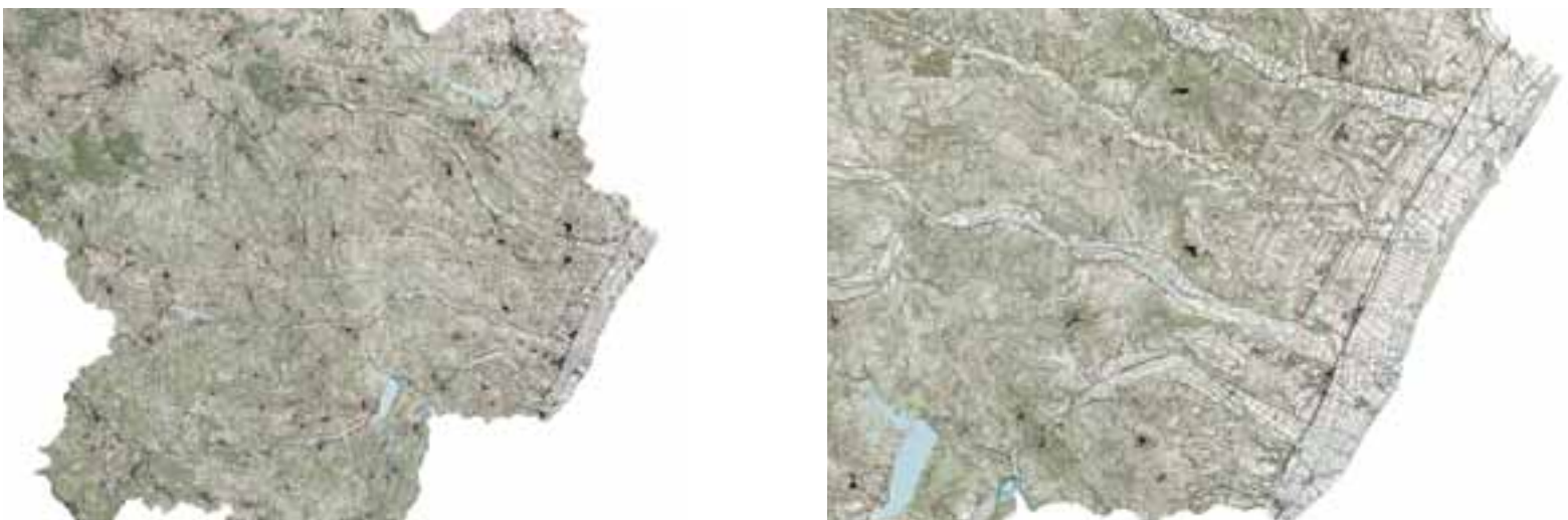
Fig. 2, 3 | Modern Reclamation Landscapes: Metaponto Plain and its territory (credits: C. Brisotto and A. Raffa, 2023; source: RSDI Basilicata, 2023).

A significant approach is the one that led the OMA / Rem Koolhaas studio to the elaboration of the project for Haarlemmermeerpolder (1986). The Dutch studio explores the future urban dimension of a polder starting from its modular structure. The structure is recognized as an ordering and stable element and as an articulation of a multiplicity of possible uses. OMA projects the agricultural armature of the polder soil – a remnant of a centuries-old culture of mutual adaptation between society and environment (van Bergeijk and Piccinini, 2022) – into a new urban dimension where past and future dialogue with the present