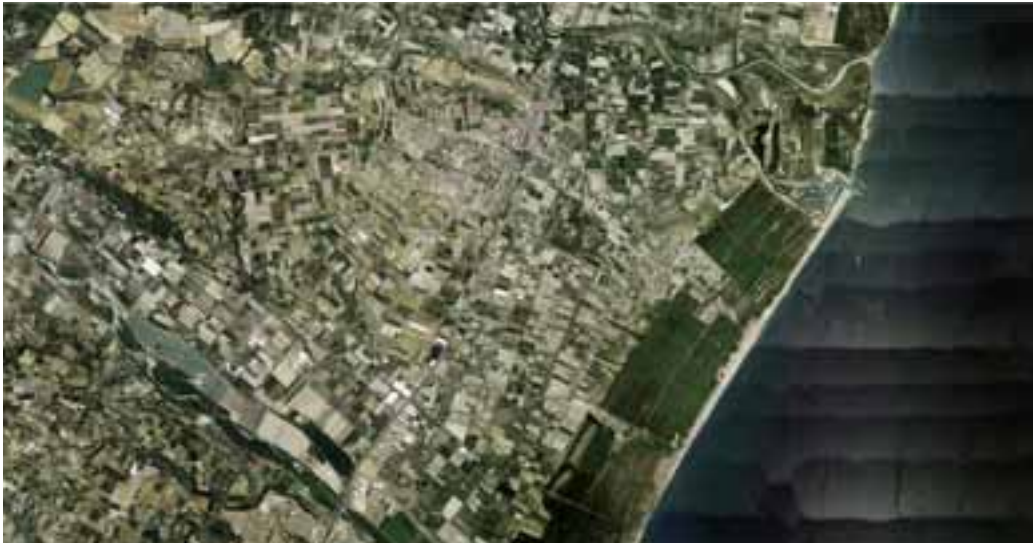
Fig. 7 | Module: settlement infrastructure (credit: C. Brisotto and A. Raffa; source: Google Earth, 2023).

by juxtaposing architectures, elements, and uses with different relationships with the reclamation module. The aim is to establish unity and coherence without eradicating differences and incongruities (Van Gerrewey, 2015). The plot of the agricultural infrastructure of the polder becomes an opportunity to experiment with multiple urban configurations: building densifications and large urban infrastructures alternated to green public spaces for agriculture and recreation, wooded areas and a controlled flooding area with fish farming and renaturation spaces.