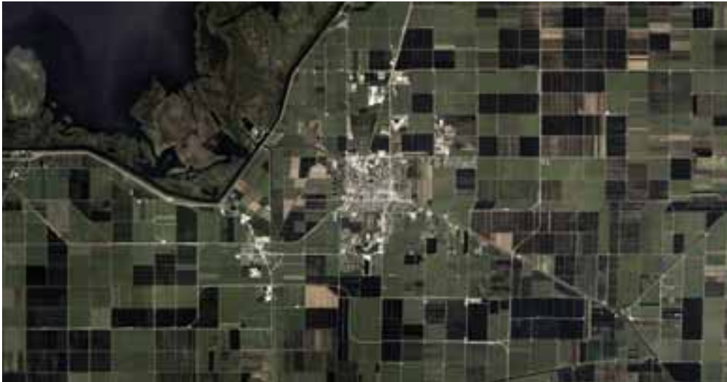
Fig. 13 | Module: EAA settlement infrastructure (credit: C. Brisotto and A. Raffa; source: Google Earth, 2023).

proach between land and water – an approach that has shaped these landscapes – that needs to be rethought from a systemic perspective (Walker and Salt, 2006) to develop scenarios of adaptation to the challenges of a changing climate. The correlation between land and water expressed by the module will have to face a greater complexity and activate a circular rather than a vertical dynamic.