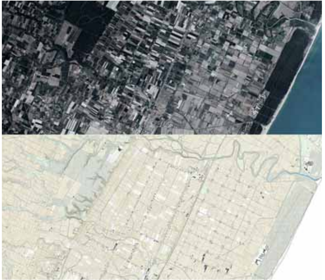
Fig. 4 | Module: Metaponto Plain and its rural patterns (credit: C. Brisotto and A. Raffa; sources: Google Earth and RSDI Basilicata, 2023).