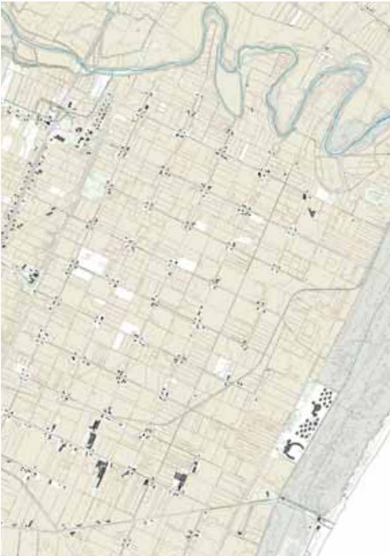
Figg. 5, 6 | Module: rural patterns and concentrated settlement infrastructure (credits: C. Brisotto and A. Raffa; source: RSDI Basilicata, 2023).