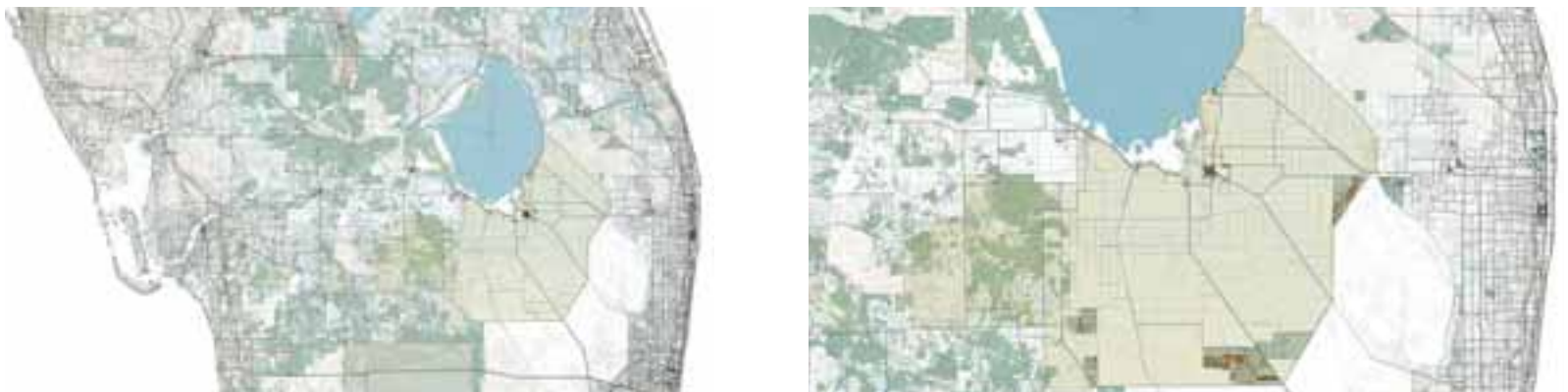
Fig. 8, 9 | Modern Reclamation Landscapes: EAA (credits: C. Brisotto and A. Raffa; source: data UF Geoplan Center-Florida Geographic Data Library, 2023).

In the American case, a zoning logic divides the Everglades hydrologically and topographically, reorganizing the natural space through a complex water system that entirely changes the water flow on a regional scale (Figs. 7, 8). The wild nature of the swamp is maintained in certain areas but eliminates its original ecological functionality. The spatial grid of paths and canals organize the fertile soil close to Lake Okeechobee, the EAA (Fig. 9), to maximize the efficiency of the agricultural production system (Figg. 10-13). It is precisely the anthropocentric and segregated ap-